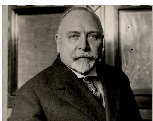
Carl Theodor Zahle