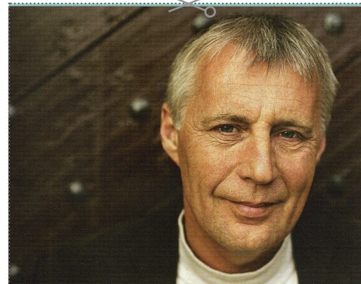
Henrik Dam Kristensen